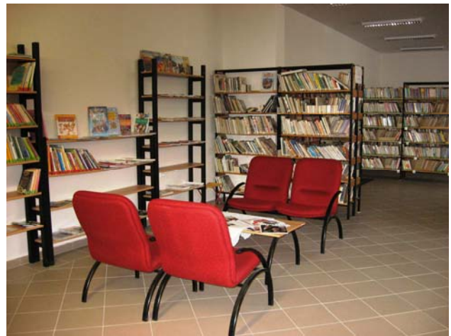
Obecní knihovna Dolní Bojanovice

V okrese Znojmo byla koncem roku přestěhována do zrekonstruovaných prostor Místní knihovna v Tvořihrázi, za pomoci regionálního oddělení bude probíhat obnova její činnosti.