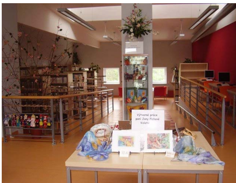
Interiér Obecní knihovny Mokrá-Horákov