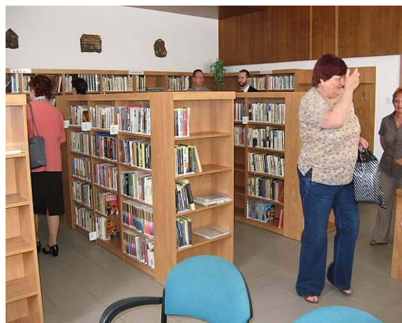
Místní knihovna Deblín

V okrese Břeclav byly přestěhovány do nových prostor Místní knihovna v Kobylí a Místní knihovna v Brumovicích