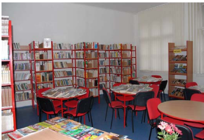
Místní knihovna Drásov

V městysi Drásov (okres Brno-venkov) byla přestěhovaná knihovna z nevyhovujících prostor do budovy Základní školy a Mateřské školy T. G. Masaryka a sloučena se školní knihovnou. Slavnostní otevření proběhlo v říjnu 2008. Novou knihovnicí se stala učitelka školy. Knihovna bude sloužit všem obyvatelům městyse. Byla také nově podepsaná smlouva o poskytování regionálních funkcí.