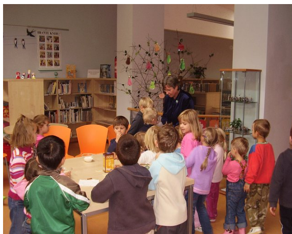
Obecní knihovna Mokrá-Horákov