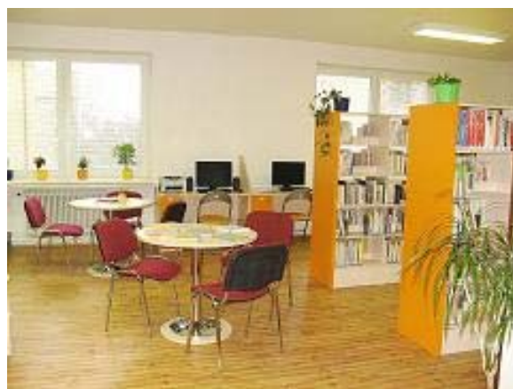
Městská knihovna Zbýšov

V okrese Břeclav byly přestěhovány do nových prostor Místní knihovna v Kobyli a Místní knihovna v Brumovicích.