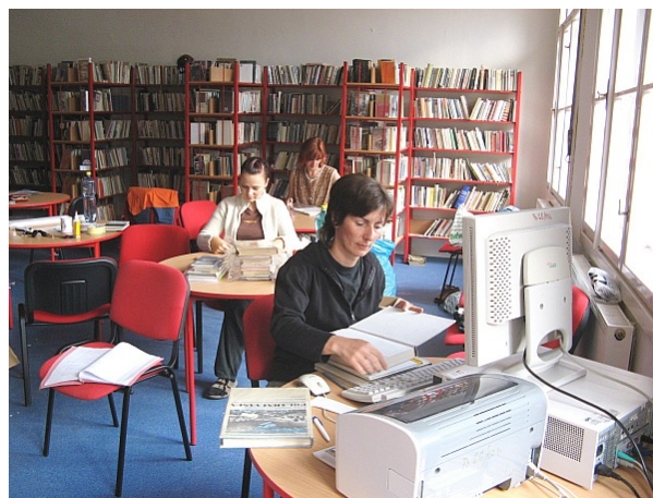
Probíhající revize v Obecní knihovně Drásov

Přestěhovaná do nových prostor byla Obecní knihovna v Ostrovačicích: ( www.knihovnaostrovacice.wz.cz ).