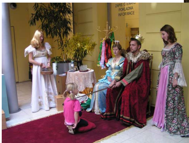
Pasování prvňáčků v Knihovně Jiřího Mahena v Brně