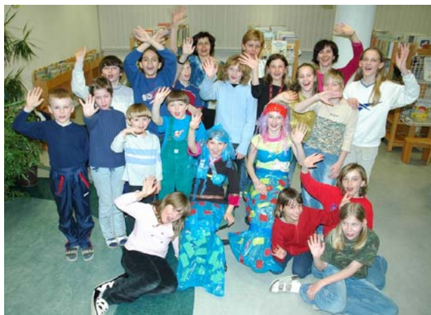
Noc s Andersenem v Městské knihovně Blansko