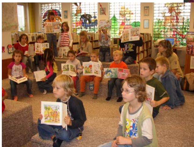
Beseda v dětském oddělení MĚK Břeclav