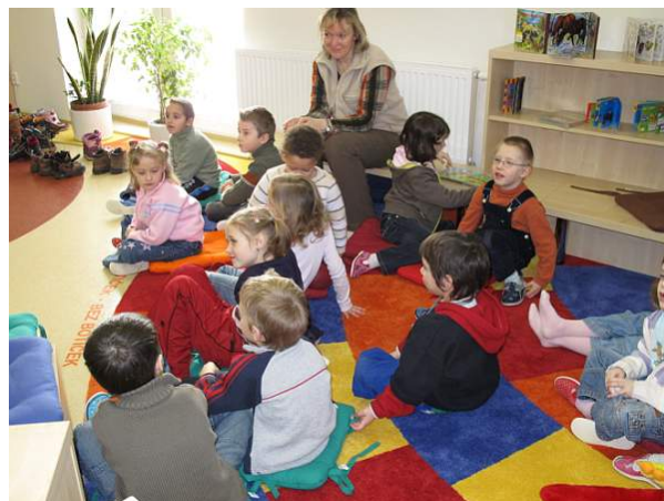
Týden čtení 2008 v pobočce Brno-Maloměřice

V okrese Brno–venkov byla v obci Deblín přestěhovaná knihovna do nových prostor bývalé prodejny v prostorách obecního úřadu. Slavnostní otevření proběhlo 14.5. 2008. Knihovna byla vybavena novým nábytkem, má samostatnou místnost pro děti, stanici veřejného internetu a vlastní