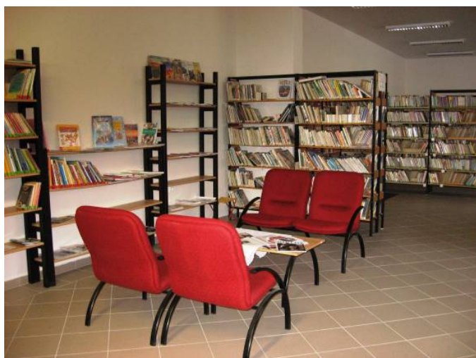
Obecní knihovna Dolní Bojanovice