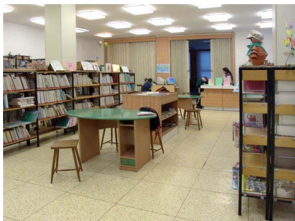
Půjčovna MěK Hodonín