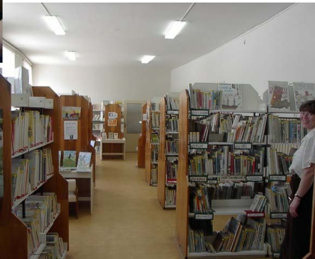
Půjčovna Městské knihovny Boskovice