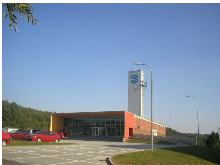
Budova Obecní knihovny Mokrá-Horákov