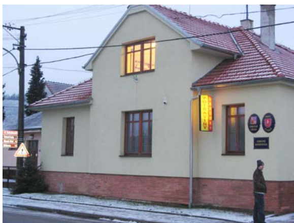
Obecní knihovna Česká

Do nových prostor byla přestěhovaná také Obecní knihovna v České. Celkovou rekonstrukcí prošla Městská knihovna Zbýšov ( http://naseknihovna.cz/zbysov/ ).