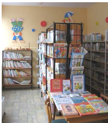
Místní knihovna Prušánky

V okrese Znojmo byla koncem roku přestěhována do zrekonstruovaných prostor Místní knihovna v Tvořihrázi, za pomoci regionálního oddělení bude probíhat obnova její činnosti.