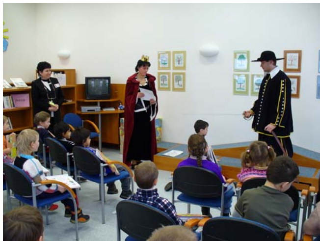
Dětské oddělení KKD Vyškov