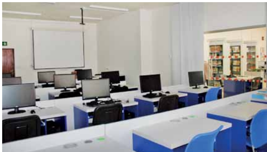
PC učebna v Městské knihovně Hodonín, vybudovaná 2013

V roce 2013 patřil JMK se zájmem o vzdělávání v celostátním srovnání na 5. místo podle počtu obsluhovaných knihoven.