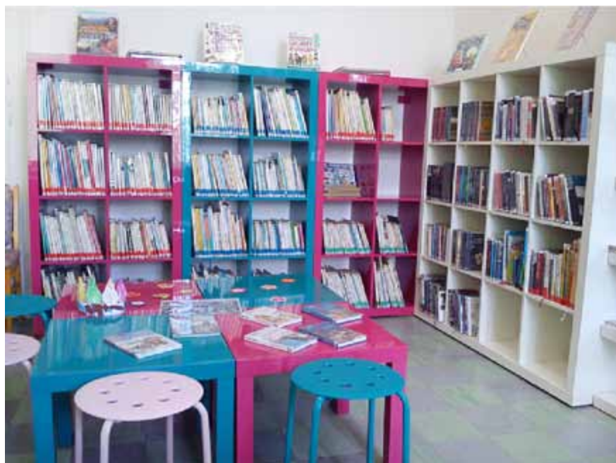
Obecní knihovna Jaroslavice (okres Znojmo)