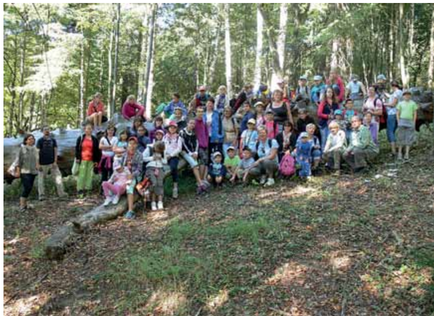
Putování lysickou oborou (4. ročník projektu Setkání čtoucích rodin regionu Blansko)

Na zajištění a podpoře kulturně výchovné činnosti spolupracovat se SKIP a kulturními organizacemi v místě.