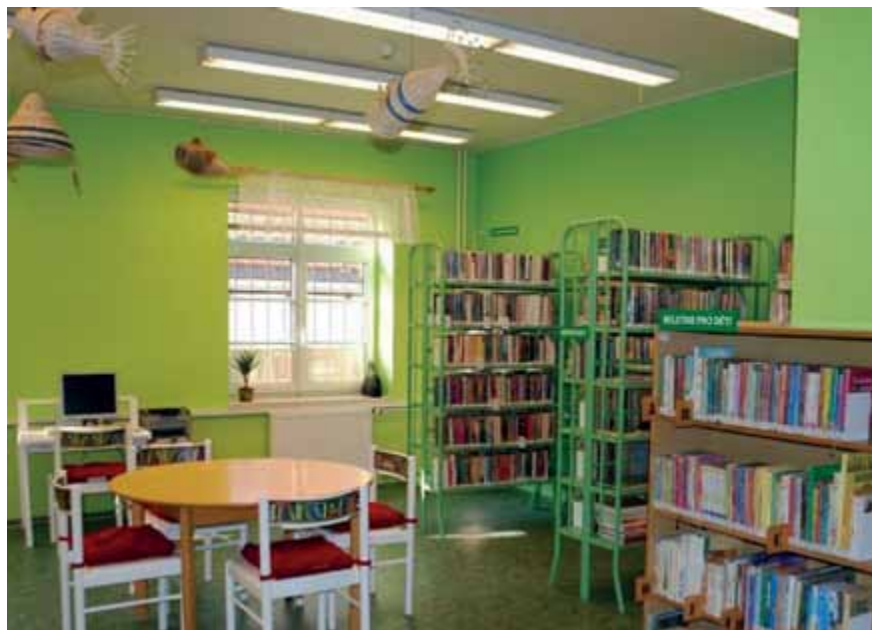
Jedna z menších poboček Knihovny Jiřího Mahena v Chrlicích, rekonstrukce 2013