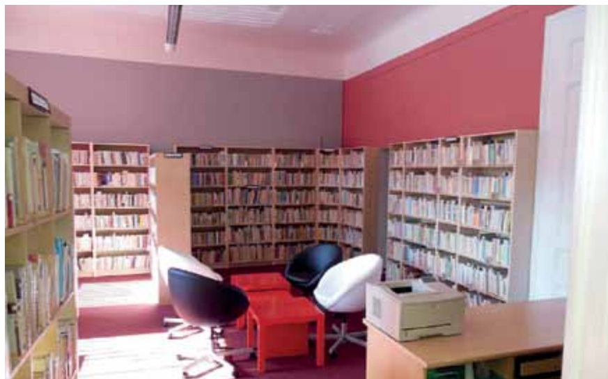
Obecní knihovna ve Křtínách (okres Blansko)