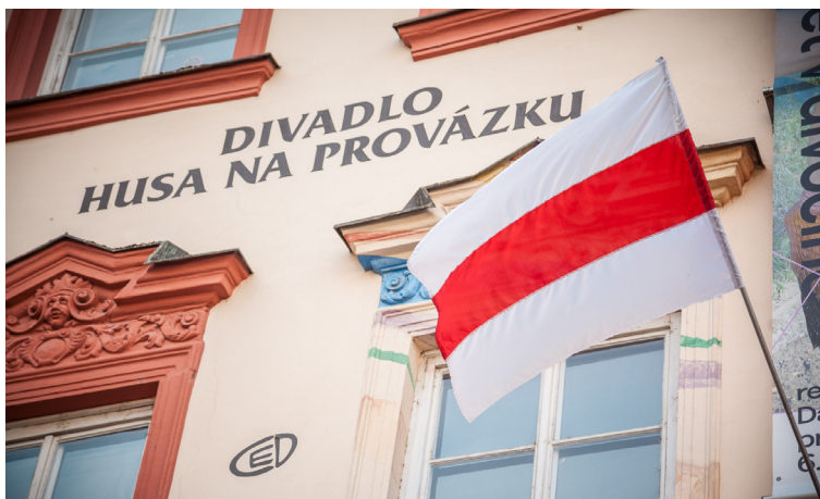
Běloruská vlajka v Brně na budově Divadla Husa na provázku / Centra experimentálního divadla