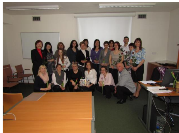
Účastníci a lektori rekvalifikačního knihovnického kurzu 2013/2014

Součástí výuky je návštěva odborných pracovišť MZK a dalších vybraných brněnských paměťových institucí.