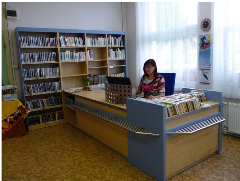
Nový výpůjční pult a nové regály na pobočce v Žebětíně

http://www.kjm.cz/provoz/zebetin-krivankovo-nam-35