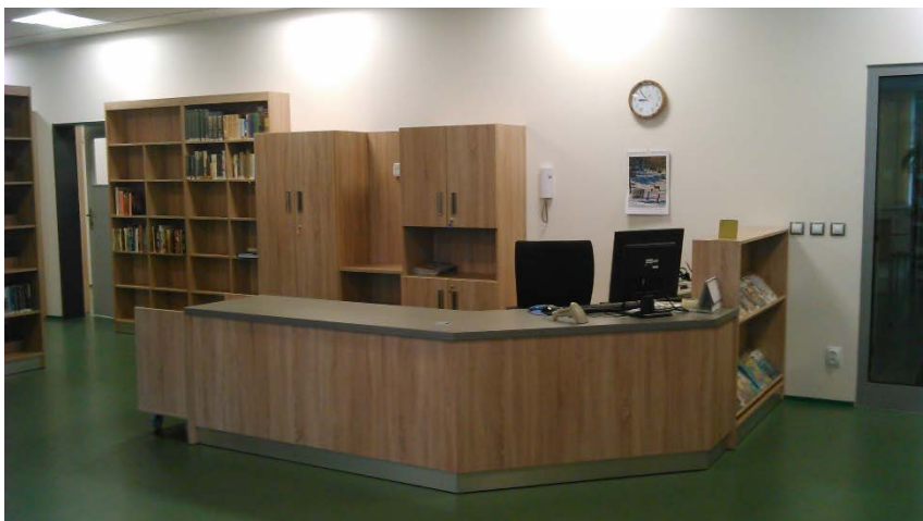
Nové prostory a nové interiéry Městské knihovny v Sokolnicích