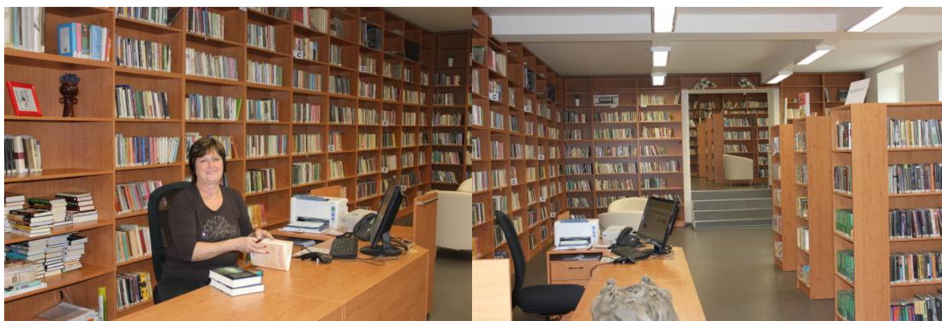
Interiéry Městské knihovny Dubňany

V srpnu byla slavnostně otevřena v nových prostorách v centru obce Obecní knihovna Rohatec . Knihovna rozšířila výpůjční dobu a rozšířila spolupráci se školou. Současně byla přeřazena z kategorie neprofesionálních knihoven mezi knihovny profesionální.