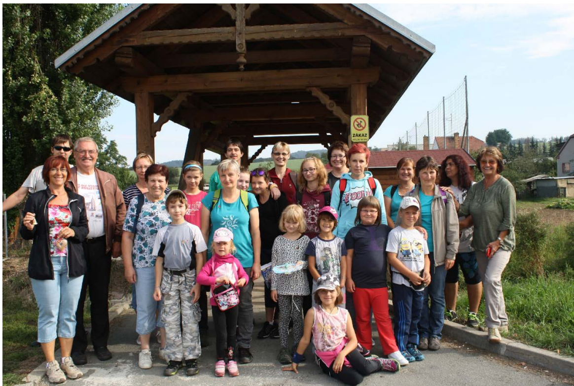
5. literárně turistické putování dětí, rodičů a knihovníků regionu Blansko dne 5.9.2015

V roce 2015 se také konalo již 5. literárně – turistické putování pro čtoucí rodiny regionu Blansko.