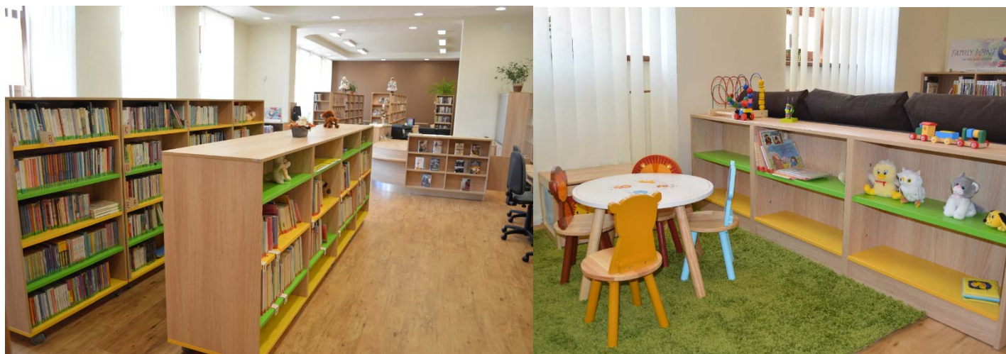
Nové interiéry Obecní knihovny Rohatec

V srpnu byla slavnostně otevřena v nových prostorách v centru obce Obecní knihovna Rohatec . Knihovna rozšířila výpůjční dobu a rozšířila spolupráci se školou. Současně byla přeřazena z kategorie neprofesionálních knihoven mezi knihovny profesionální.