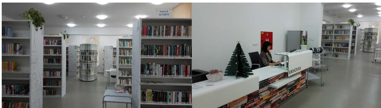
Nové interiéry Městské knihovny v Pohořelicích

V prosinci se do přízemí nově rekonstruovaných prostor bývalé radnice přestěhovala Městská knihovna v Pohořelicích . Knihovna byla ve spolupráci s architektem vybavena nábytkem, technickým vybavením, získala větší prostory a zázemí. V současné době patří k moderním, plně automatizovaným a velmi pěkným knihovnám.