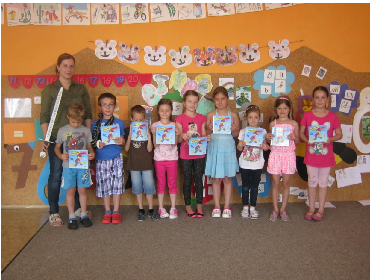
Pasování prvňáčků na čtenáře knihovny Obecní knihovně Vrbice