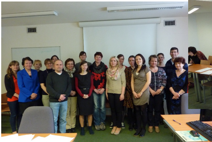
Účastníci rekvalifikačního kurzu 2014/2015 (fotografie ze závěrečných zkoušek)

V roce 2014/2015 absolvovalo kurz celkem 15 účastníků.