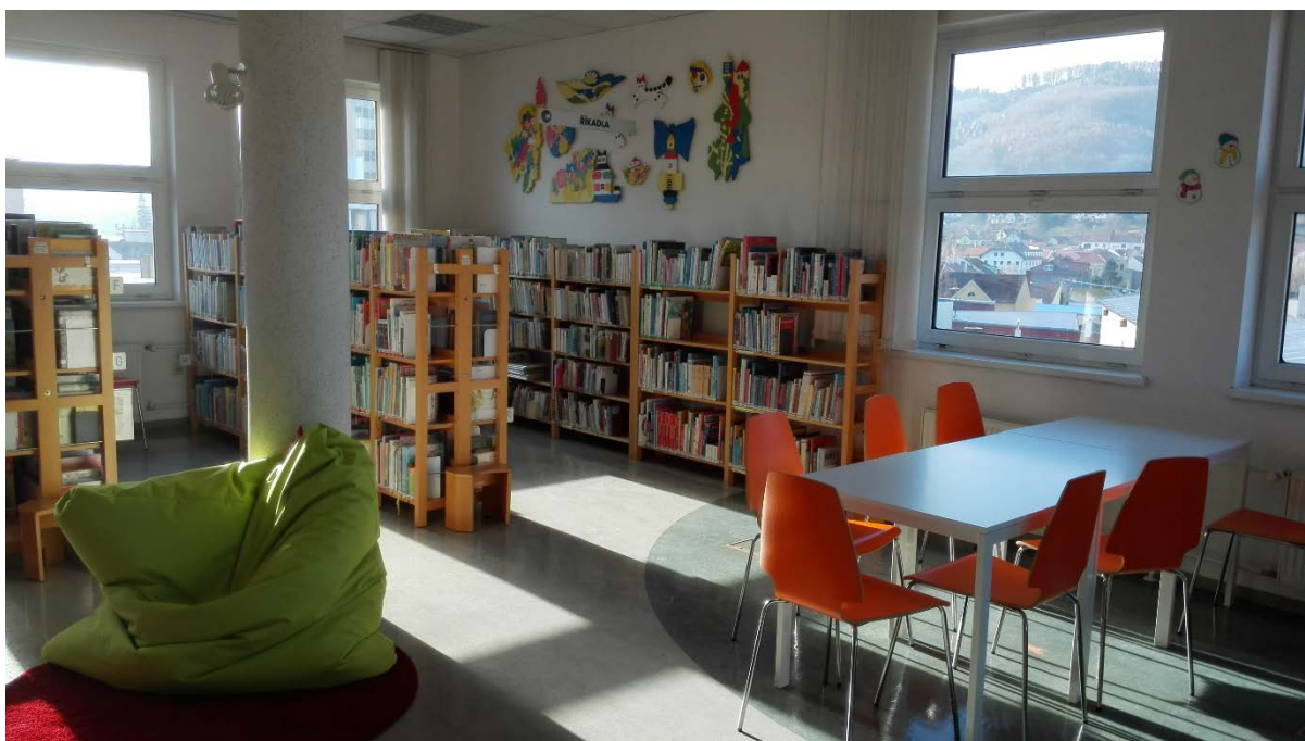
Nové interiéry v dětském oddělení

Částečnou rekonstrukcí prošla Městská knihovna v Adamově (výměna oken, částečná úprava půjčovny, zakoupení nových regálů).