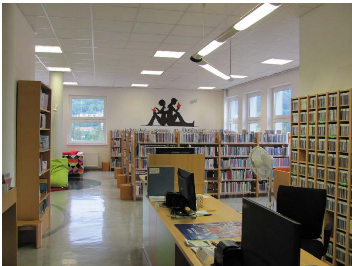
Nové interiéry oddělení pro děti a mládež

Modernizace se obešla bez stavebních úprav. Hudební oddělení se přesunulo do části knihovny věnované nejmenším čtenářům. Úpravami prošlo také dětské oddělení, které bylo nově vybaveno pohodlným sedacím nábytkem.