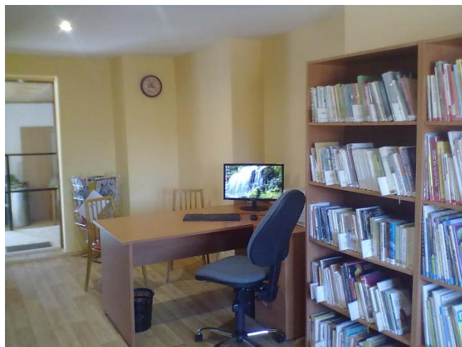
Interiéry Obecní knihovny Hnanice

K přestěhování knihovny do jiných prostor v rámci budovy obecního úřadu došlo v Obecní knihovně v Hnanicích: http://www.knihovnahnanice.webk.cz/ .