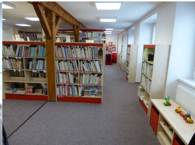
Nové interiéry Městské Jiráskovy knihovny v Újezdě u Brna

Do nových prostor byla přestěhována profesionální knihovna Městská knihovna v Sokolnicích.