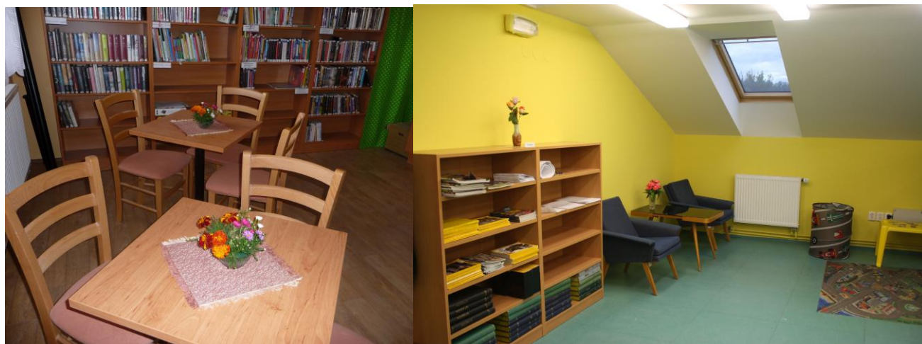
Ukázky úspěšných realizací: vlevo Obecní knihovna Vanovice, vpravo nová čtenářská místa v Knihovně Doubravice nad Svitavou

Obce Holštejn, Malá Roudka, Křtěnov, Deštná, Světlá, Velenov, Uhřice, Kořenec, Borotín, Habrůvka, Úsobrná, Suchý, Sudice, Vanovice, Spešov, Šošůvka, městyse Křtiny, obec Vavřinec, městyse Sloup, obec Rudice, městyse Ostrov u Macochy, obec Lipovec, městyse Doubravice nad Svitavou, městyse Lysice, město Kunštát.