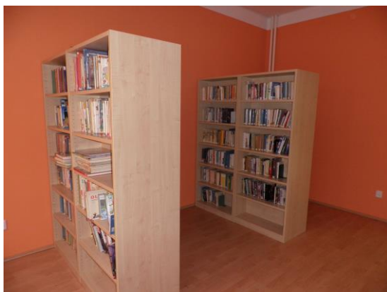
Obecní knihovna Jamolice, okres Znojmo