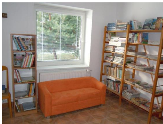
Místní knihovna Mackovice, okres Znojmo