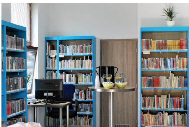
Interiéry pobočky KJM v Brně-Ivanovicích