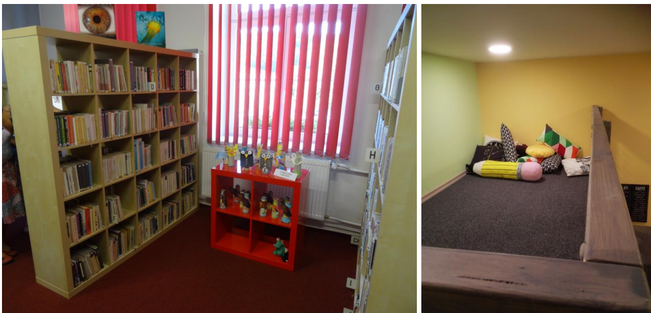
Interiéry Knihovny městyse Křtiny, vpravo literární bidýlko (fotografie archiv MZK)