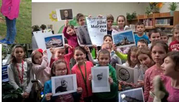
Knihovna Jiřího Mahena v Brně, pobočka Řečkovice