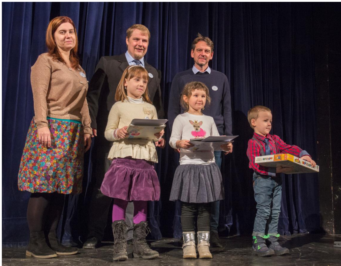
Slavnostní vyhlášení v Divadle Polárka 3. 12. 2017

Aktivitami v rámci tohoto projektu knihovny v obcích a městech opět potvrdily, že jsou přirozenými komunitními centry a oblíbeným místem setkávání všech generací. Také se díky projektu Jižní Morava čte výrazně posílila spolupráce s místními školami, veřejnými knihovnami i obcemi celé Jižní Moravy. 16