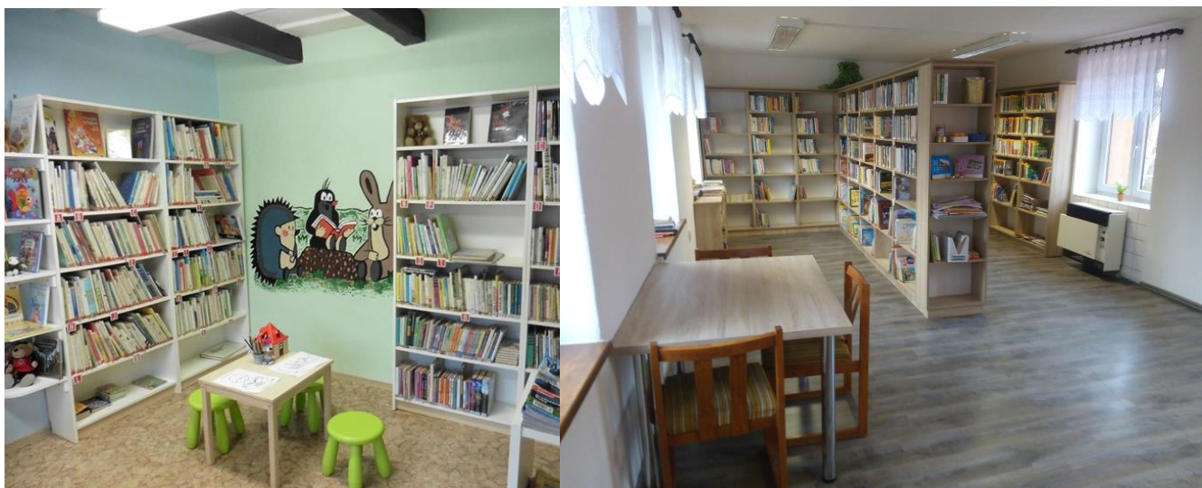
Interiéry Místní knihovny Křenovice

Do nových prostor byla přestěhovaná Místní knihovna v Křenovicích a Rašovicích, knihovny v Lysovicích, Hruškách a Snovídkách. Na vybavení knihovny novými regály čerpaly dotaci JMK knihovny Lysovice, Orlovice, Moravské Prusy, Nížkovice (druhá etapa), Hrušky a Bošovice. Malování a celkové obnovení vybavení bylo provedeno v knihovnách Letonice, Šaratice, Topolany, Milonice. První etapa rekonstrukce knihovny byla zahájena v Brankovicích – malování a částečná obměna regálů s dětskou literaturou. V Kučerově pořídili 3 notebooky, židle a roletové skříně, v Hodějicích regály a nový PC, v Krásensku nový PC. V Rašovicích dovybavili knihovnu dekoracemi a pořídili čtečky e-knih, které budou půjčovat uživatelům. V Habrovanech pořídili kromě nových regálů také knihovní systém RegARL, a tím se přiřadili jako poslední ke knihovnám se samostatným knihovním systémem.