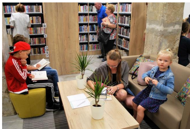
Interiéry pobočky KJM v Brně-Medlánkách