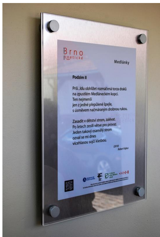
Z fasády u vstupu, pobočka KJM v Brně-Medlánkách

Brněnský básnický místopis aneb Brno poetické – projekt Ústavu pro českou literaturu AV ČR, v. v. i., ve spolupráci s Františkem Schildbergem