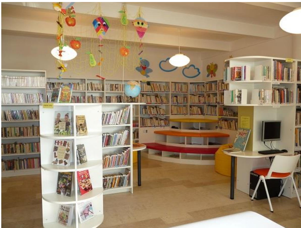
Nové interiéry Obecní knihovny Šakvice

Nově přestěhované, případně nově vybavené knihovny byly v roce 2017 v obcích Milovice, Březí (s podporou dotace JMK), Nový Přerov (s podporou dotace JMK), Sedlec (s podporou dotace JMK), Popice (s podporou dotace JMK), Podivín, Týnec (s podporou dotace JMK), Rakvice, Příbice, Strachotín.