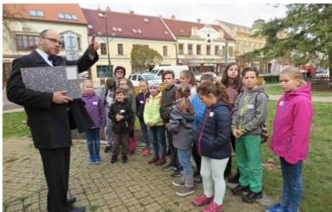
Městem Hodonínem s babičkou a dědečkem (fotografie Michaela Macková)