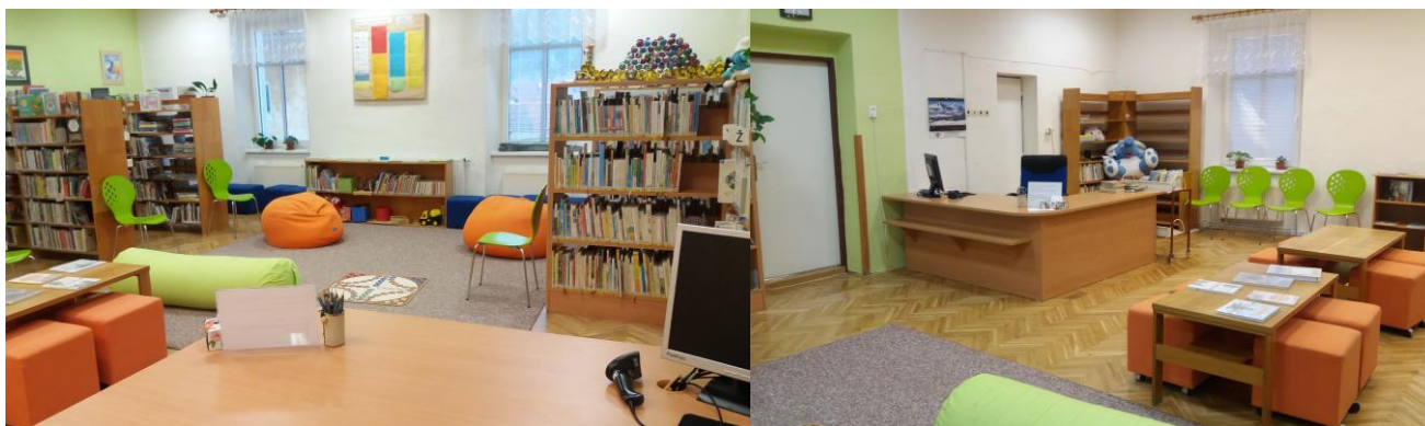
Nové interiéry Knihovny městyse Lysic

V Knihovně městyse Lysic se uskutečnila 1. etapa rekonstrukce dětského oddělení z dotace JMK. Byl pořízen nový výpůjční pult a vznikl prostor pro realizaci tvořivých dílen.