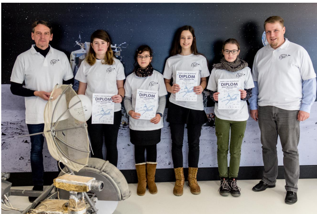
Vyhlášení výsledků krajského kola na Hvězdárně a planetáriu Brno 10. 12. 2017