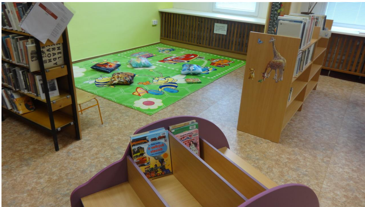
Nové prostory pro děti v Obecní knihovně Sloup

Rozšířila se také výpůjční doba knihovny – pravidelně bude otevřeno v úterý od 11,30 do 13,30 a v pátek od 17.00 do 19.00.“ 15